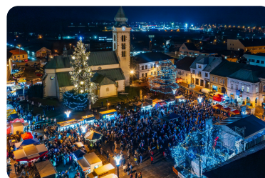
Zaži zimné mesto