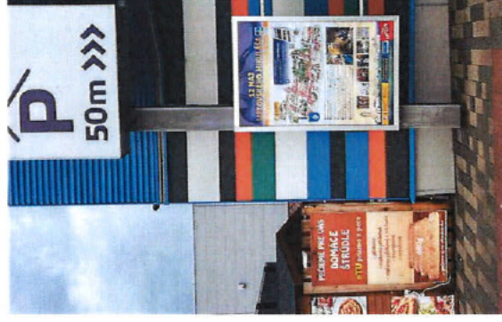
VIZUALIZÁCA - CITYLIGHT č.15