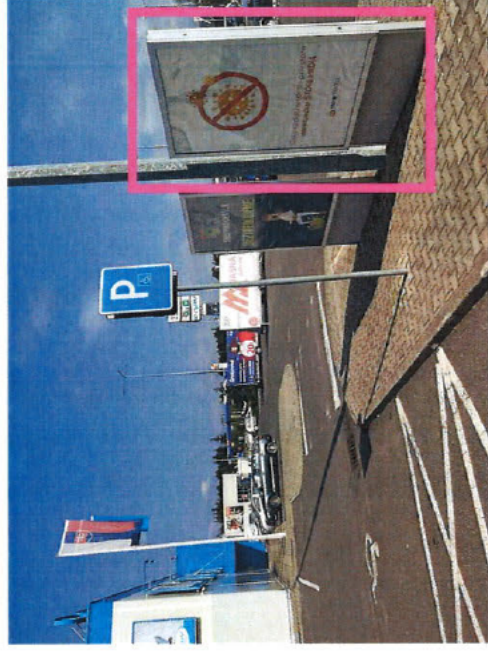
VIZUALIZÁCA - CITYLIGHT č.20