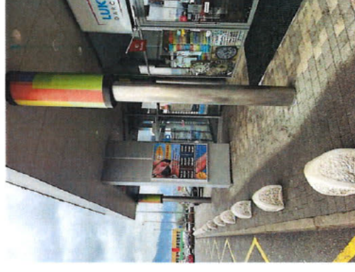
VIZUALIZÁCA - CITYLIGHT č.12