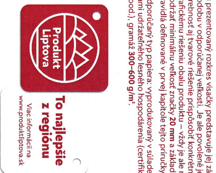
alternatívny farebný variant

Odporúčany typ papiera: vyprodukovaný v súlade so zásadami udržateľného lesného hospodárenia (certifikát FSC a pod.), gramáž 300–600 g/m 2 .