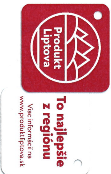
alternatívny farebný variant

Odporúčany typ papiera: vyprodukovaný v súlade so zásadami udržateľného lesného hospodárenia (certifikát FSC a pod.), gramáž 300–600 g/m 2 .