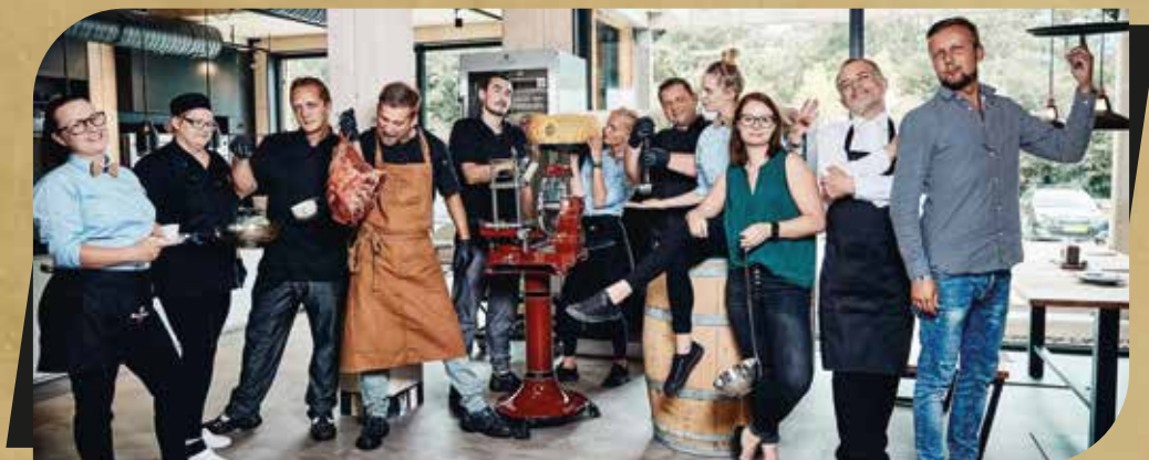
Kolektív reštaurácie PINUS.

Nech sa páči, vyberte si z ponuky našich jedál. Veríme, že Vám bude chutiť.